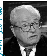
J.-M. Le Pen